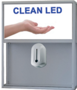
Clean Led Mural