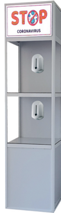
Clean Led Portatif

A réception de votre bon de commande, vous recevrez votre facture ainsi que notre RIB afin de procéder au règlement de cette dernière par virement. Votre Clean Led, prêt à l'emploi, vous sera livré dans les 30 jours suivant la date de valeur du paiement.